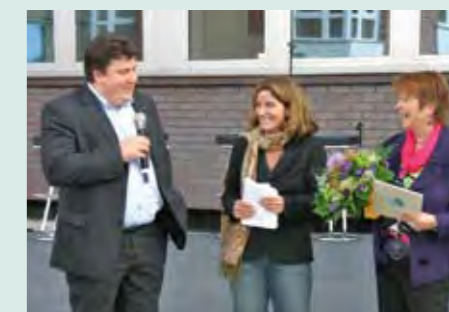
Mirko Dragowski, MdA und Mechthild Rawert, MdB (rechts) mit Frau Sylke Gandzior bei der Einweihung des Rheuma-Liga-Zentrums am 4.9.2010.

Zu 14.: Die Rheuma-Liga Berlin e. V. bietet den von Erkrankungen des rheumatischen Formenkreises Betroffenen und deren Angehörigen ein sehr gutes spezialisiertes und komplexes Angebot. Die psychosoziale wohnortnahe Beratung in Beratungsstellen, Schwerpunktpraxen und –ambulanzen sowie der Aufbau und die Anleitung von Selbsthilfegruppen werden vom Senat im Rahmen des Integrierten Gesundheitsvertrages gefördert. Oberstes Prinzip der Arbeit ist die Hilfe zur Selbst-